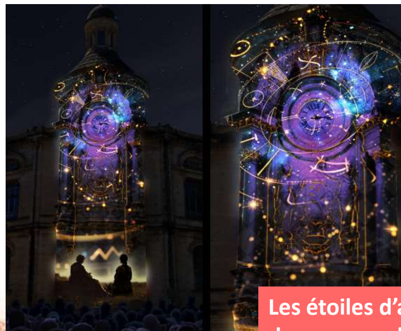
Les étoiles d'après Les Lettres de mon moulin d'Alphonse Daudet – Horloge Lycée