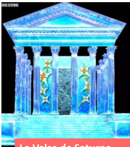
La Valse de Saturne