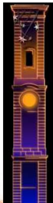
La Tour de Magie