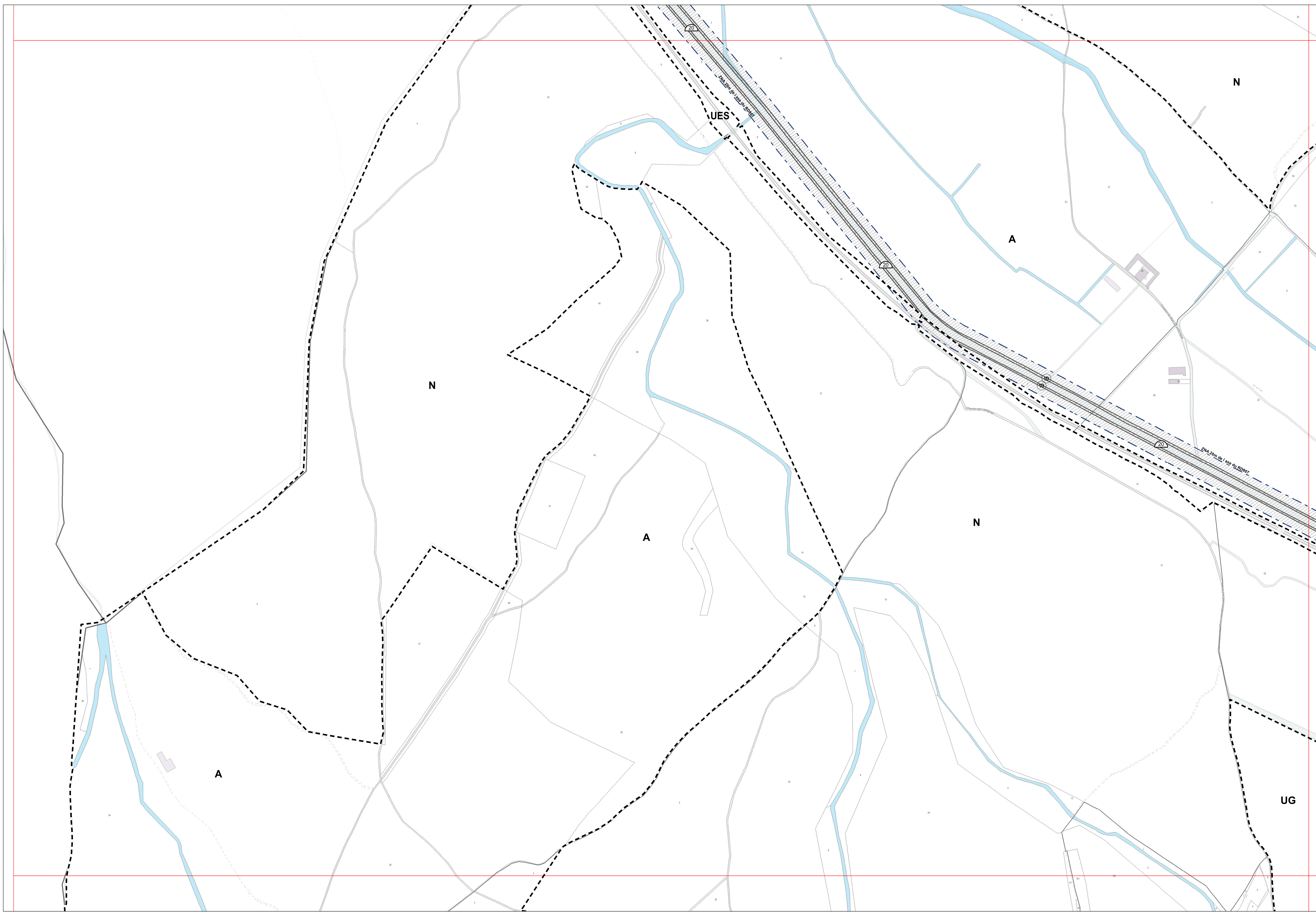
TABLEAU D'ASSEMBLAGE : 1/100 000ème